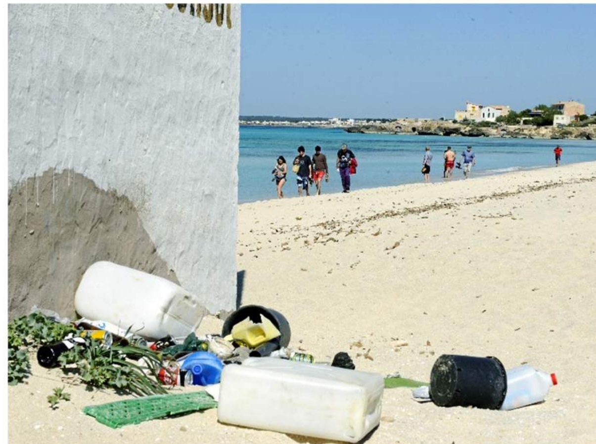
ES TRENC, MALLORCA

'L'abandonament dels residus al medi natural s'esdevé durant l'estiu a les platges naturals de les Illes Balears. Burilles, botelles i embalatges de plàstic, taps, canyetes i coberts, bosses de plàstic i ampolles de vidre se situen entre els residus més freqüents tant a la mar com a la platja els mesos d'estiu. De fet, segons el Ministeri d'Agricultura i Pesca, Alimentació i Medi Ambient el 45 % dels fems marins tenen l'origen en l'ús turístic del litoral, que inclou l'ús recreatiu de les platges i l'activitat nàutica.'