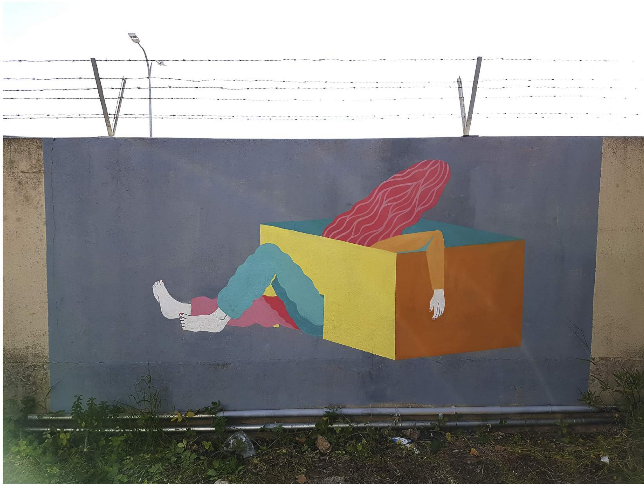
Intervención urbana 'BOUNDRIES', Mallorca (2017)