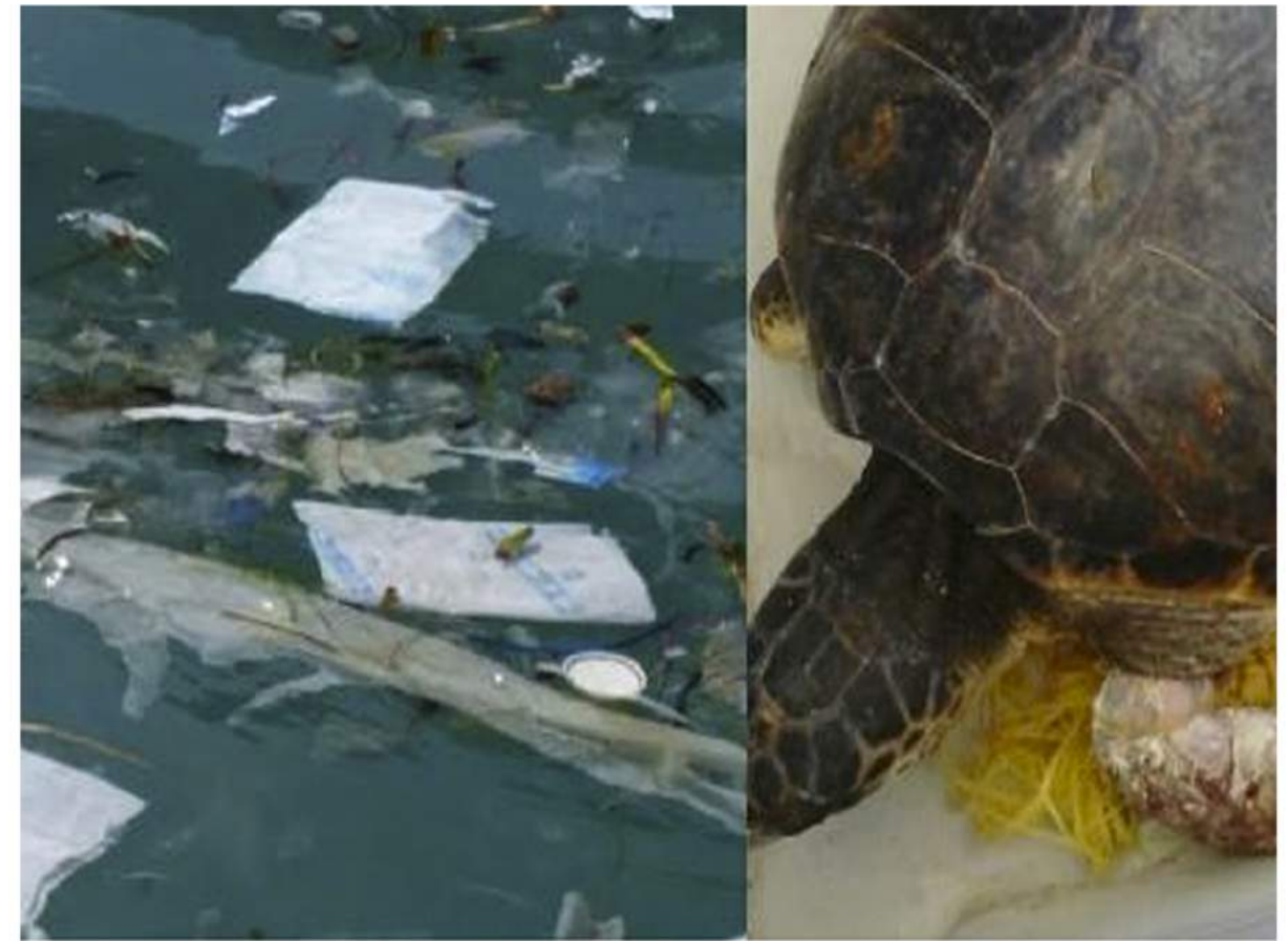
CABRERA, MALLORCA (GOB)