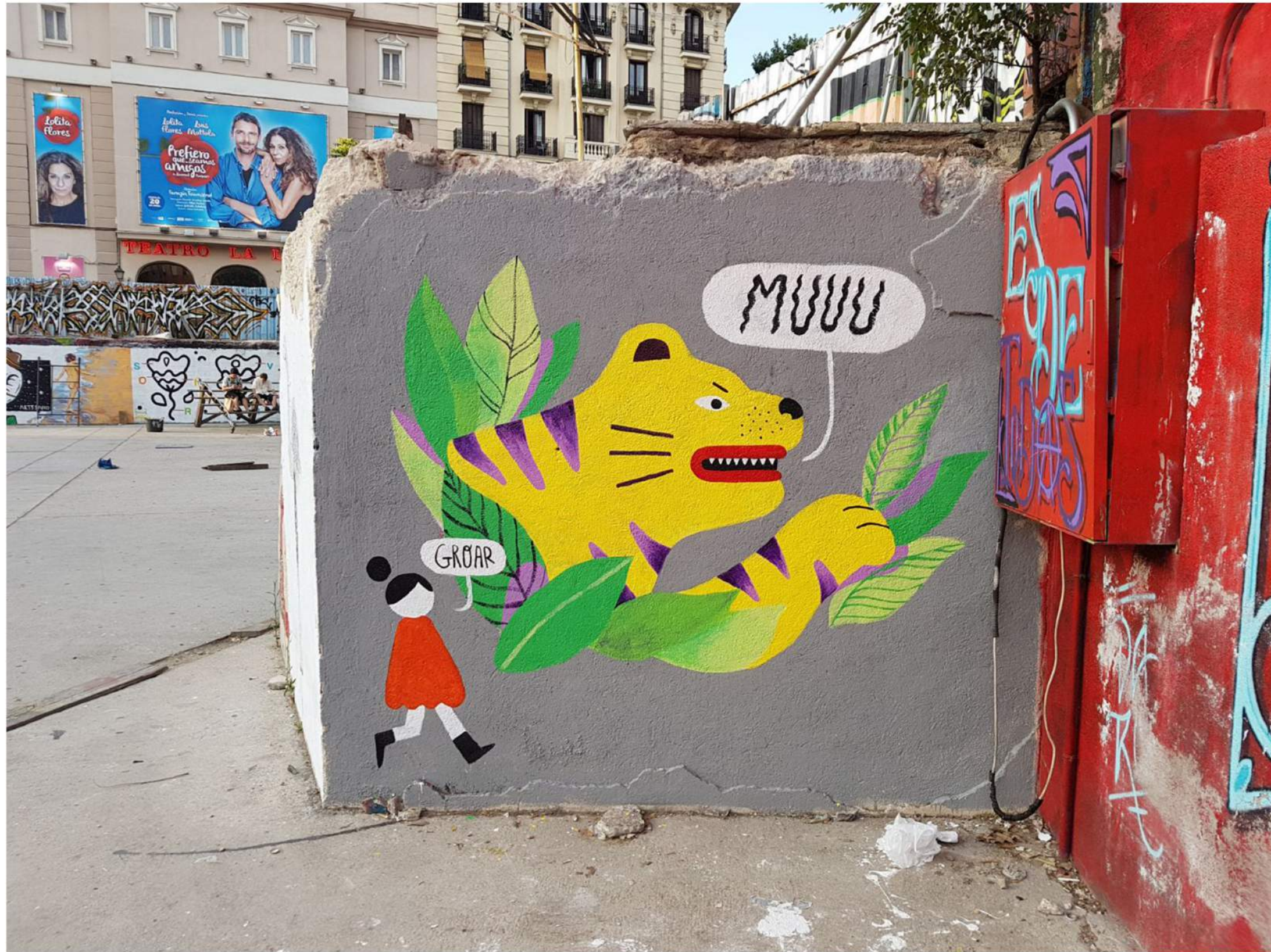
Mural en el Campo de la Cebada, Madrid (2017)