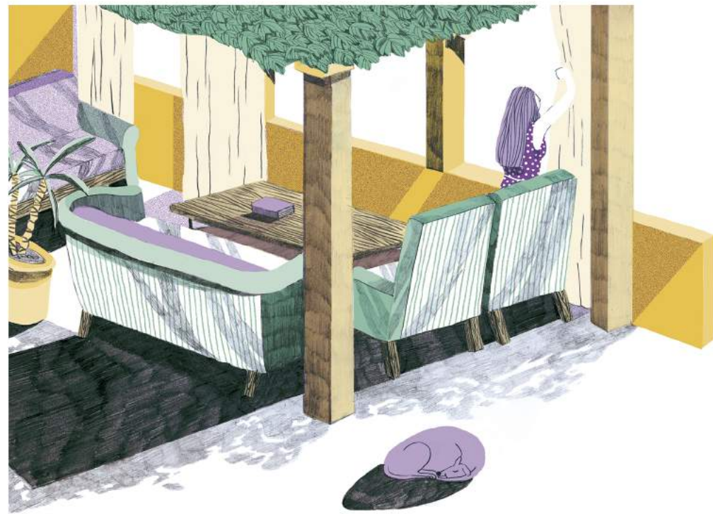
Ilustraciones para la revista Interiores (2017)