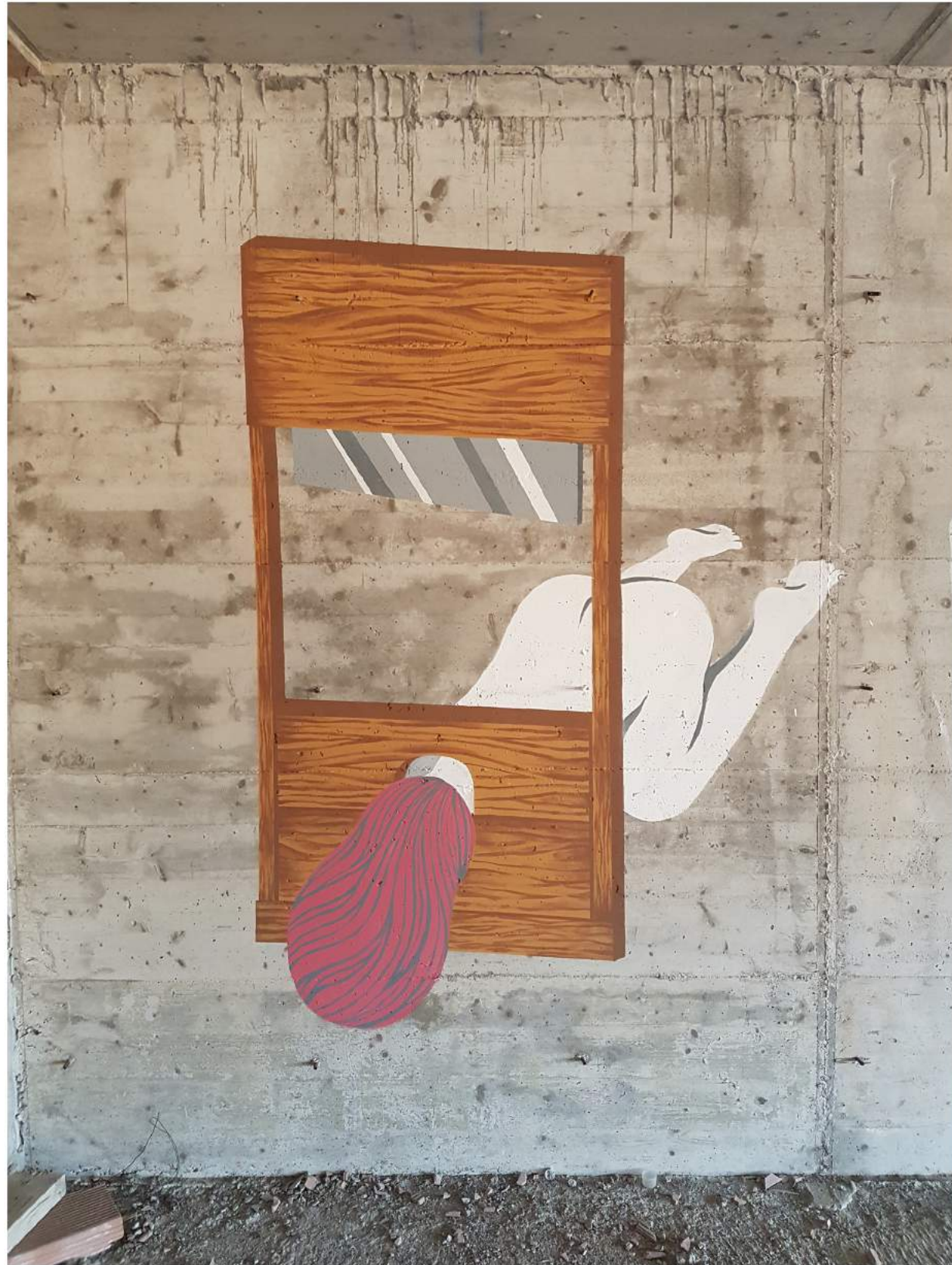
Intervención urbana 'FEMINAZI', Mallorca (2017)