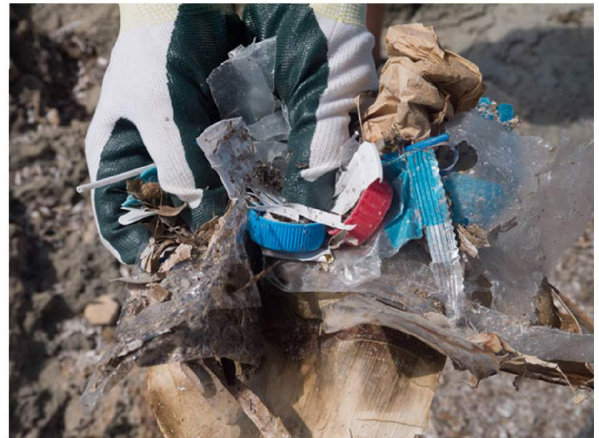
ES DOLÇ, MALLORCA (GOB)