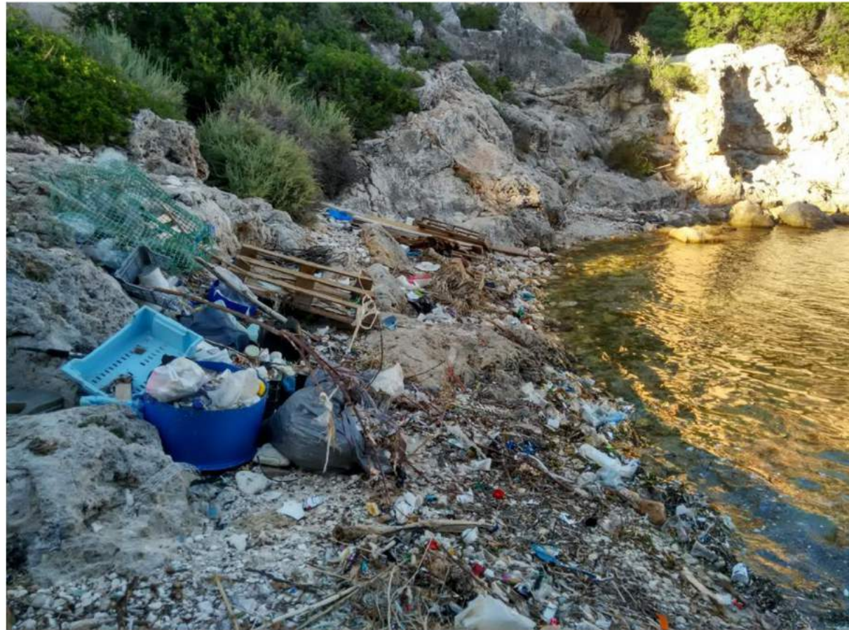
CALA FIGUERA, MALLORCA