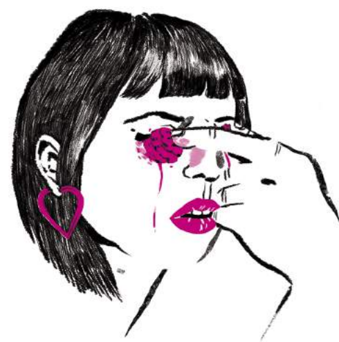
Fanzine CMYK editado por Ora Labora Estudio Gráfico (Salamanca) Risografía y Serigrafía (2017)