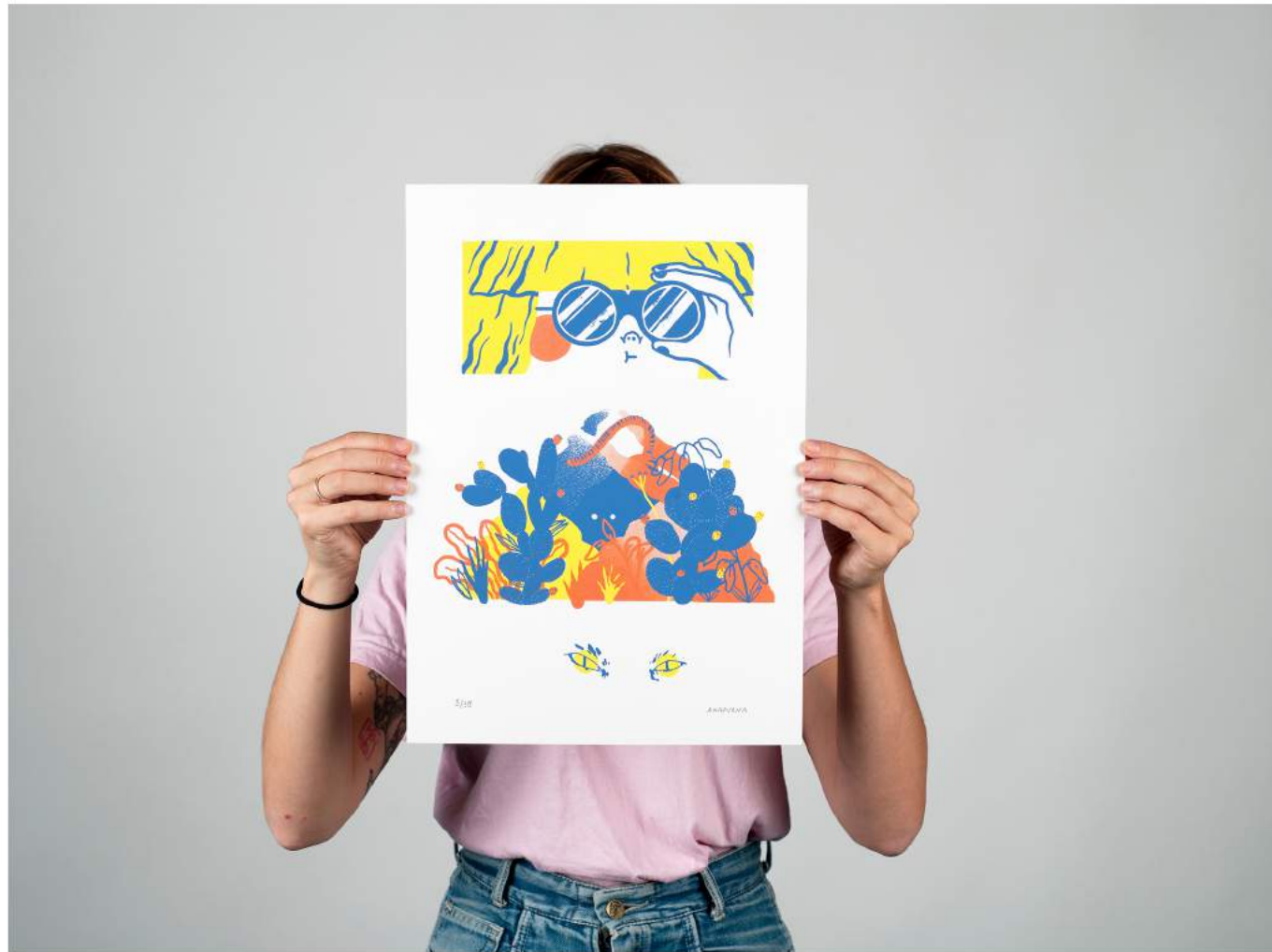
Serigrafía #2, parte del proyecto colectivo Coñojungla