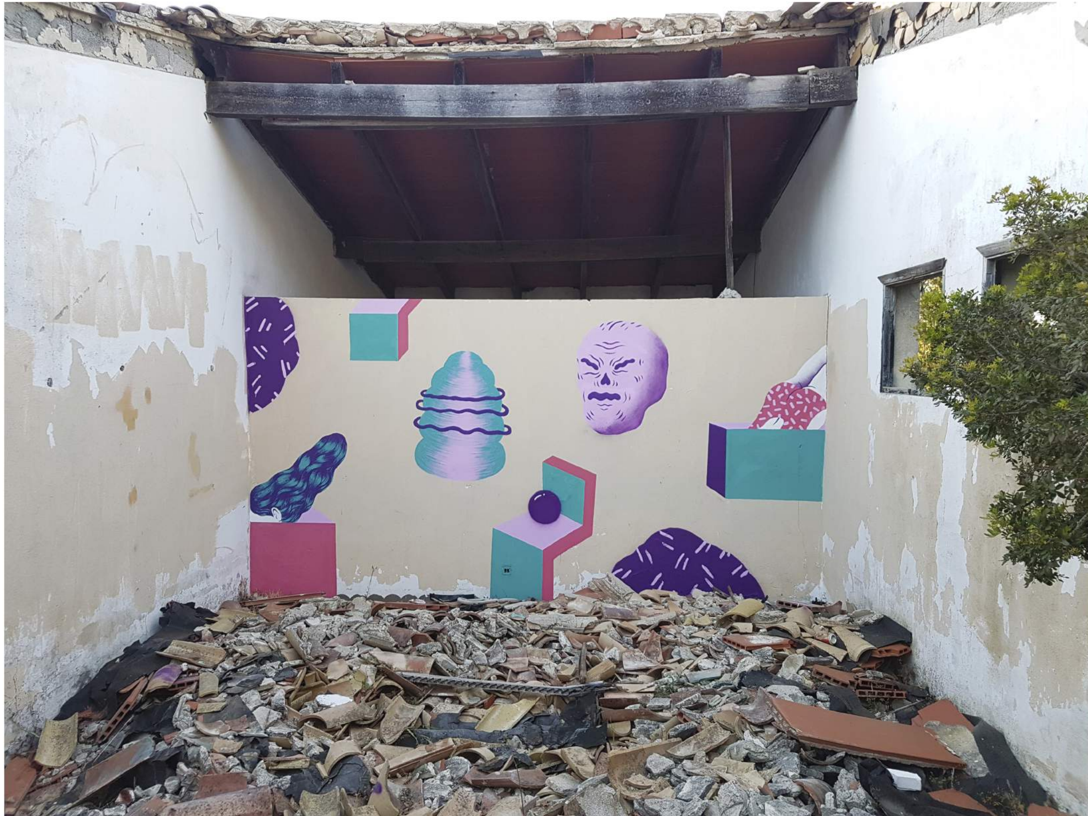
Mural del colectivo 'Coñojungla' (Pruna + Grip Face), Mallorca.