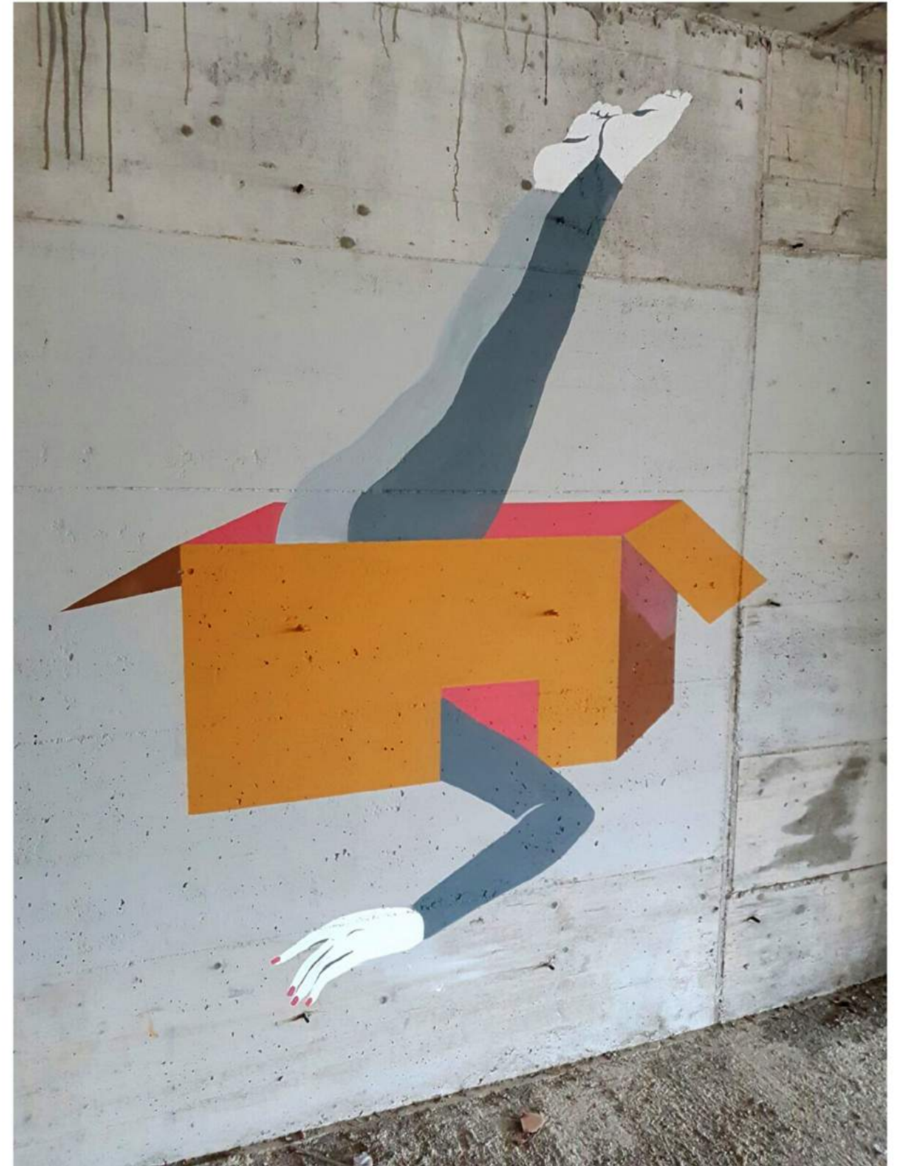
Intervención urbana 'EL BAILE', Mallorca (2017)